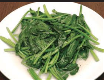
29.ほうれん草のさっぱり炒め (塩またはニシニク風味)