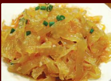
14.くらげと大根のサラダ