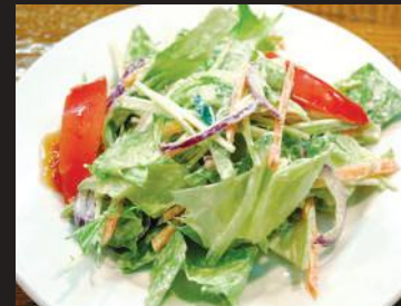
17.アボカドピリマヨサラダ