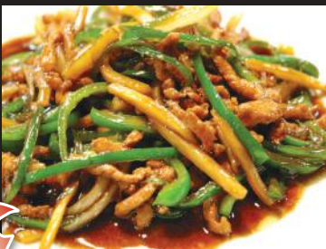
19.青椒肉絲 (チンジャオロース)