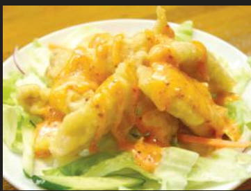
30.鶏の唐揚げ (ピリマヨ)