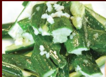
2.丸豆胡瓜ニシニク風味