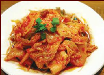
11.ゆで豚キムチ和え