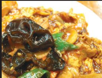
32.キクラゲと肉のオイスターソース炒め