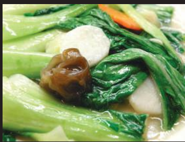
28.チンゲン菜と山芋の塩炒め