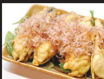
25.なすの唐揚げ(特製ソースがけ)