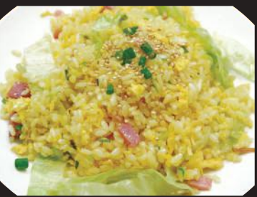
31.たまごレタスチマーヘン