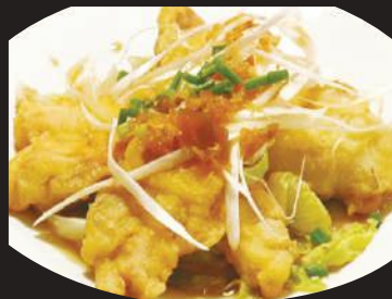
20.油淋鶏ユーリシチー