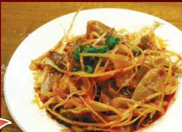
1.ガーサイとネギの辛味和え