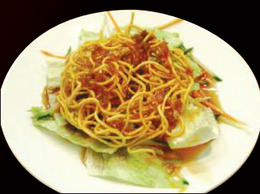
13.揚げそば(天一坊特製ソース)