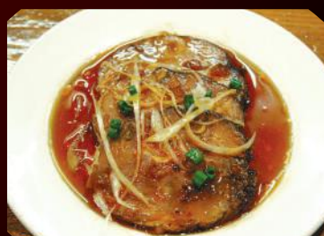
18.つまみチマーシュー