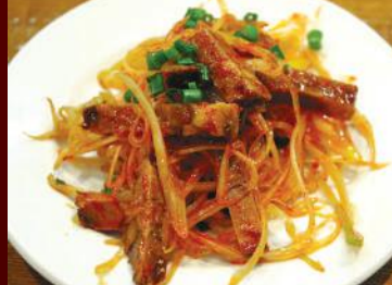
7.辛味ネギチマーシュー