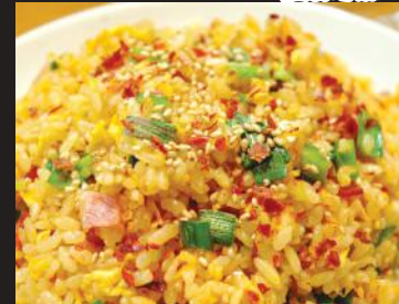
33.肉入りキムチチマーヘン