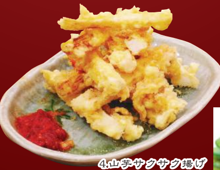
4.山芋サクサク揚げ