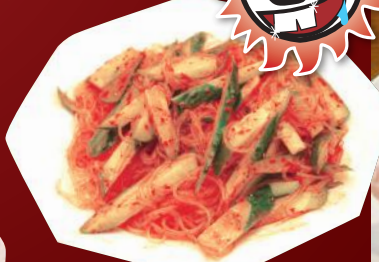
5.胡瓜と春雨の和え物