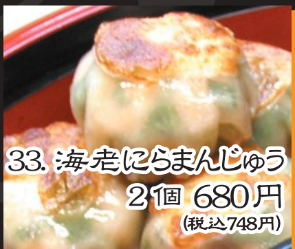
33. 海老にらまんじゅう 2個 680円 (税込748円)