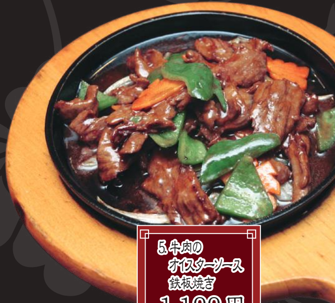
5. 牛肉の オムライス 鉄板焼き 1,100円 (税込 1,210円)