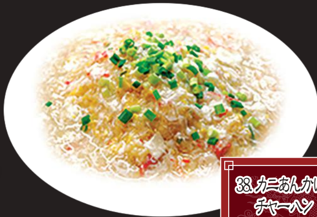
38. 鶏あんかけ チャーハン 880円 (税込 968円)