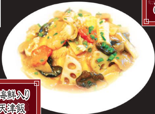
42. 海鮮入り 天津飯 1,100円 (税込 1,210円)