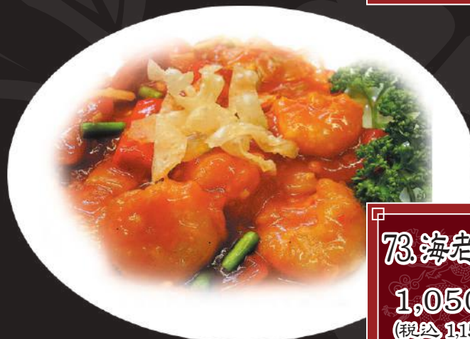
73. 海老チリ 1,050円 (税込 1,155円)