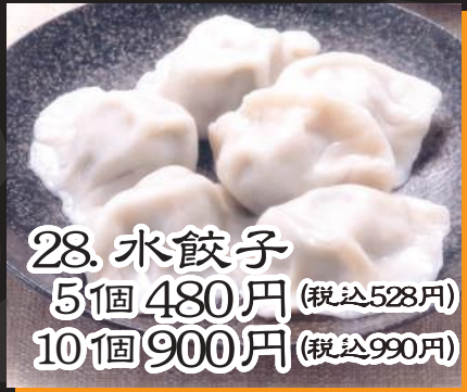
28. 水餃子 5個 480円 (税込528円) 10個 900円 (税込990円)