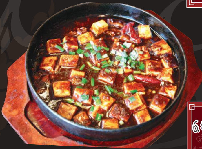
6. 特製麻婆豆腐 880円 (税込 968円)