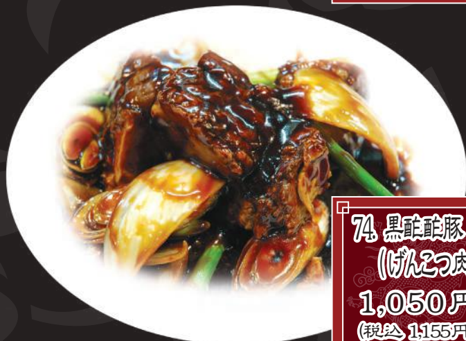
74. 黒酢酢豚 (げんこつ肉) 1,050円 (税込 1,155円)