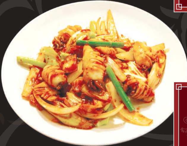
4. 揚げ辛味 ソース炒め 900円 (税込 990円)