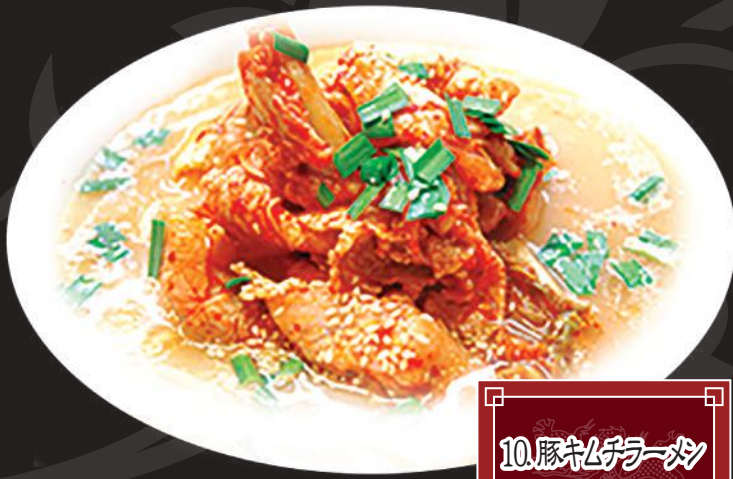
10.豚キムチラーメン 880円 (税込 968円)