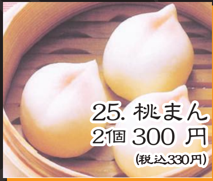
25. 桃まん 2個 300円 (税込330円)