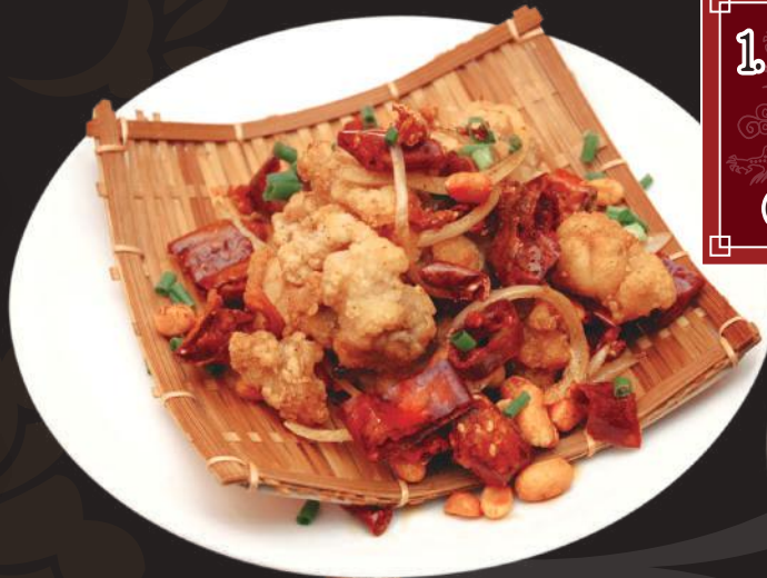
1. 鶏の唐揚げ かじし和え 780円 (税込 853円)