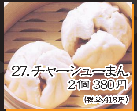
27. チャーシューまん 2個 380円 (税込418円)