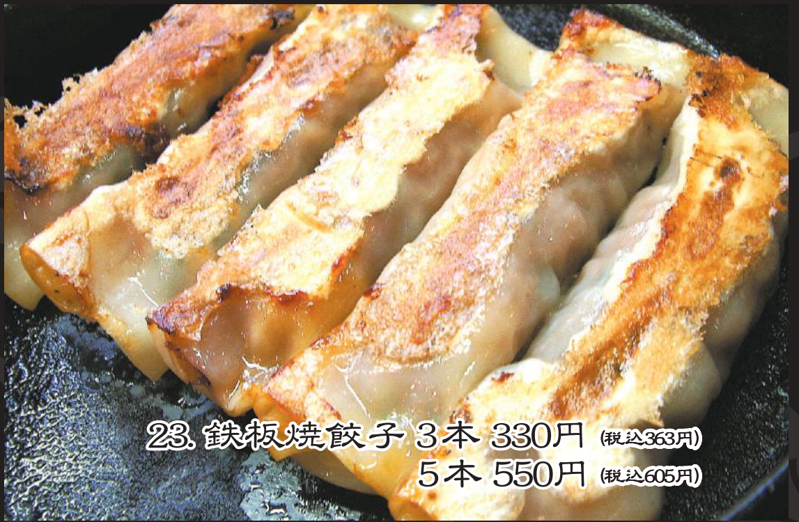
23. 鉄板焼餃子 3本 330円 (税込363円) 5本 550円 (税込605円)