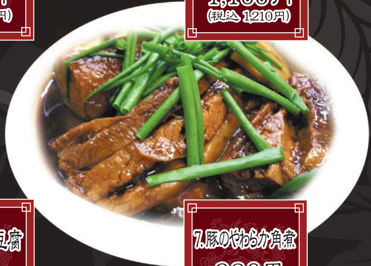
7. 豚のやわらか角煮 980円 (税込 1,078円)