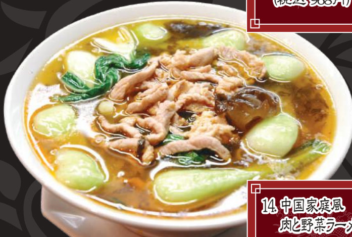
14.中国家庭風 肉と野菜ラーメン 950円 (税込 1,045円)