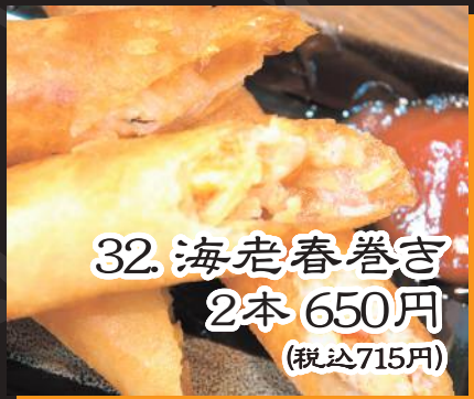
32. 海老春巻き 2本 650円 (税込715円)