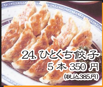
24. ひとこぢ餃子 5本 350円 (税込385円)