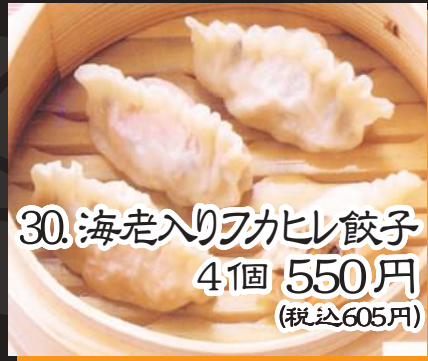
30. 海老入りアカヒレ餃子 4個 550円 (税込605円)