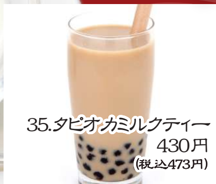
35. タピオカミルクティー 430円 (税込473円)