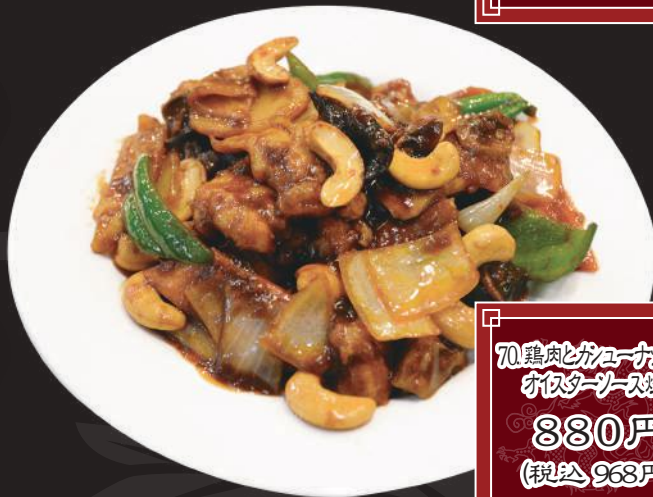
70. 鶏肉とカシューナッツの チリソース炒め 880円 (税込 968円)