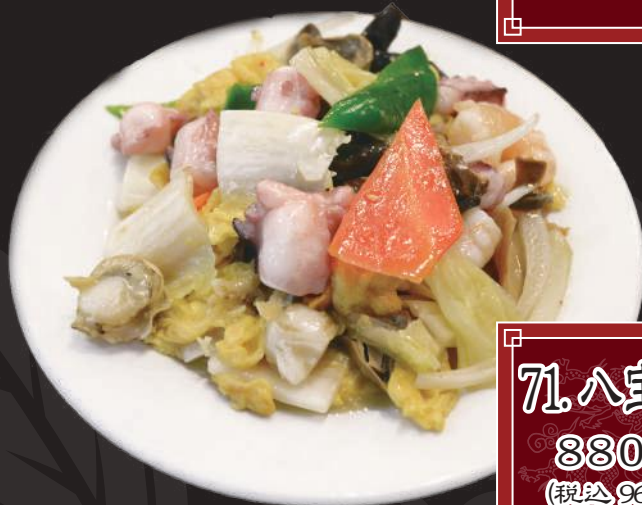
71. 八宝菜 880円 (税込 968円)