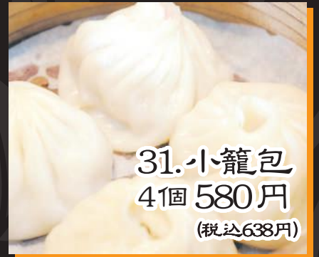
31. 小籠包 4個 580円 (税込638円)