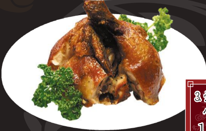
3. 骨付き地鶏の パリパリ揚げ 1,050円 (税込 1,155円)