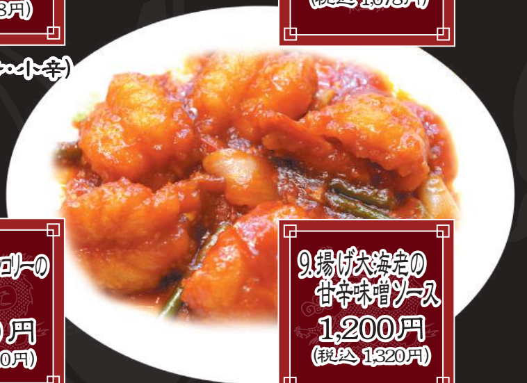
9. 揚げ大巻の 甘辛味噌ソース 1,200円 (税込 1,320円)