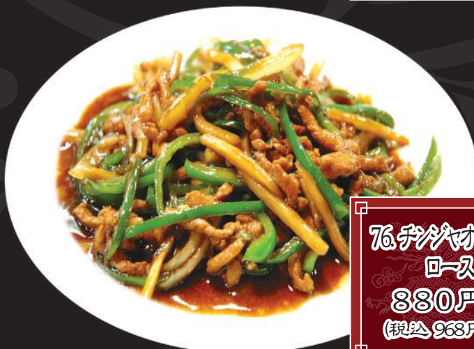
76. チリチリ 炒め 880円 (税込 968円)