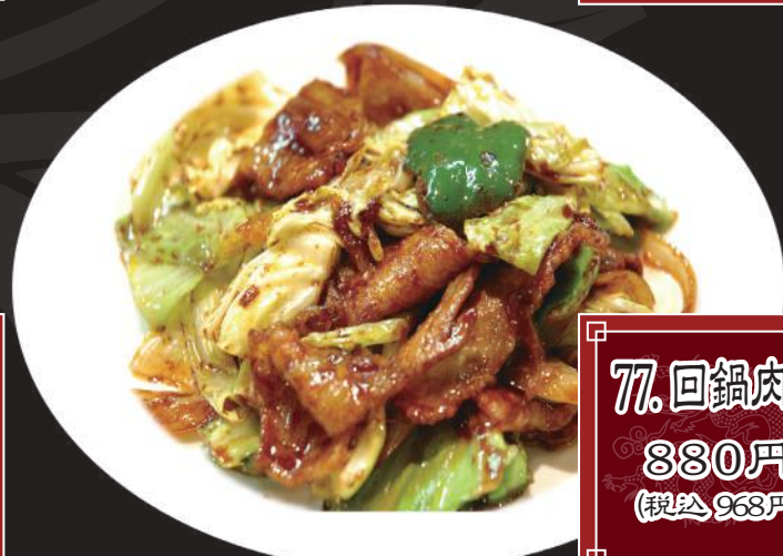
77. 回鍋肉 880円 (税込 968円)