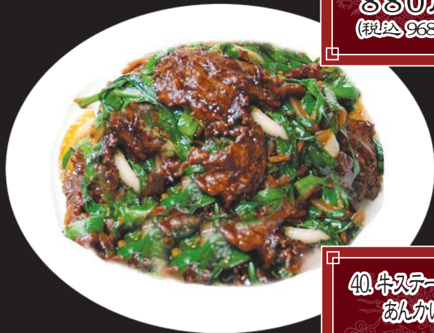
40. 牛ステーキ あんかけご飯 1,250円 (税込 1,375円)