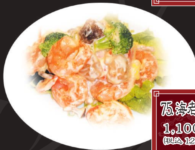
75. 海老チリ 1,100円 (税込 1,210円)