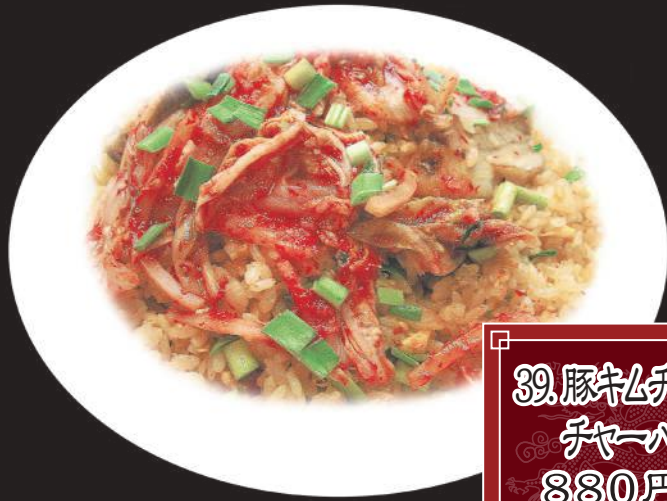
39. 豚キムチ チャーハン 880円 (税込 968円)