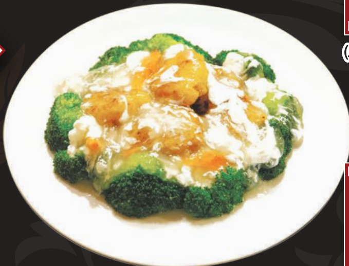
8. 本分とろろの 揚げ炒め 1,100円 (税込 1,210円)