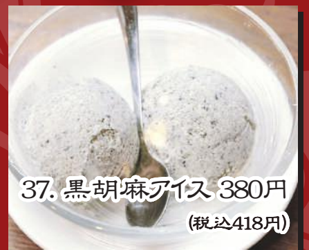
37. 黒胡麻アイス 380円 (税込418円)