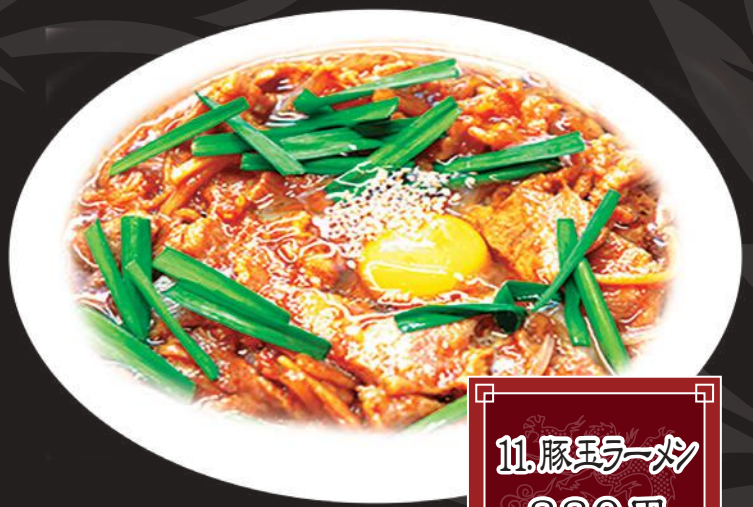
11.豚玉ラーメン 880円 (税込 968円)