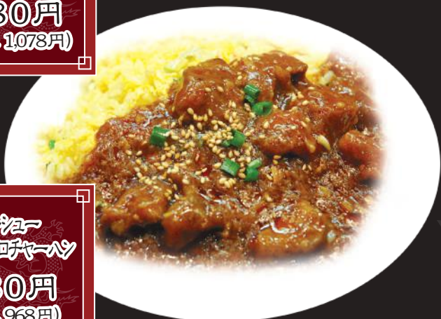
45. チャーハン ゴロロチャーハン 880円 (税込 968円)