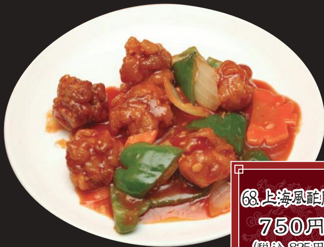
68. 上海風酢豚 750円 (税込 825円)