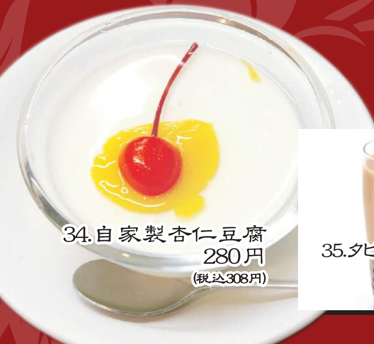
34. 自家製杏仁豆腐 280円 (税込308円)