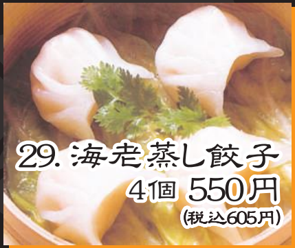
29. 海老蒸し餃子 4個 550円 (税込605円)