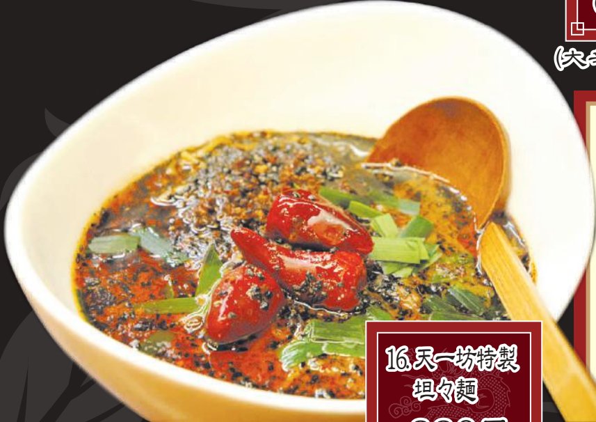
16.天一坊特製 坦々麺 880円 (税込 968円)