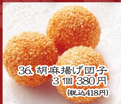
36. 胡麻揚げ団子 3個 380円 (税込418円)