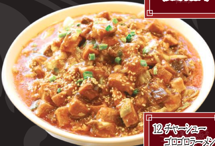
12.チャーシュー ゴロラーメン 880円 (税込 968円)