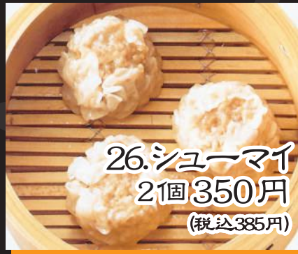
26. シューマイ 2個 350円 (税込385円)