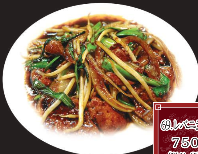
69. パクリ炒め 750円 (税込 825円)