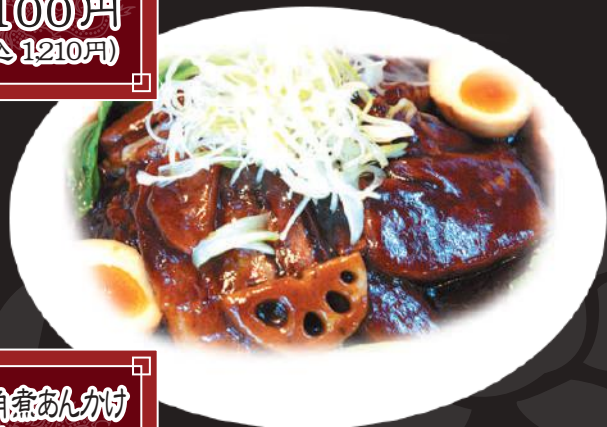
44. 角煮あんかけ ご飯 980円 (税込 1,078円)