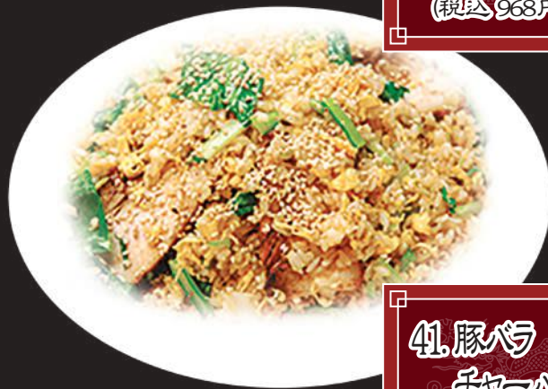
41. 豚バラ チャーハン 880円 (税込 968円)