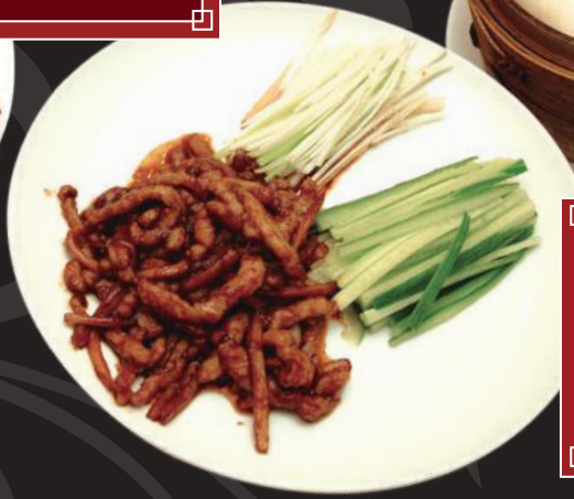
2. 豚肉千切 みそ炒め 800円 (税込 880円)