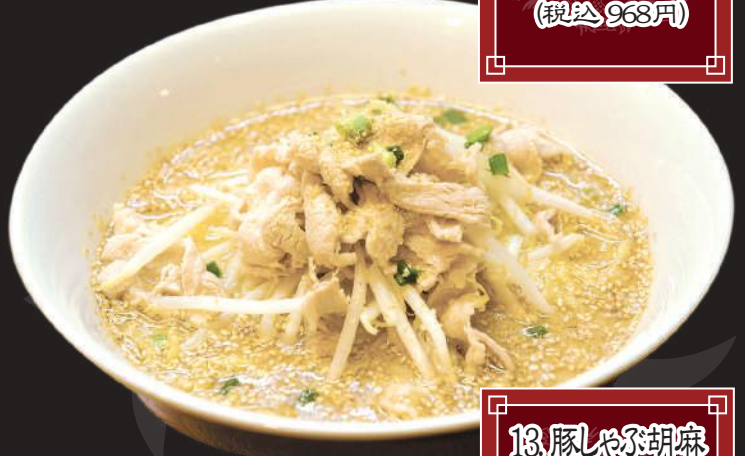
13.豚しゃぶ胡麻 ラーメン 880円 (税込 968円)